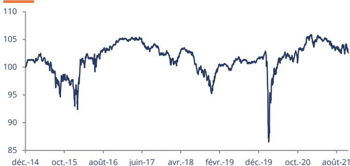
Performance affichée depuis le 31/12/2014