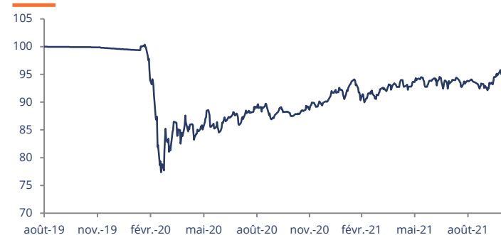
Performance affichée depuis création le 29/08/2019